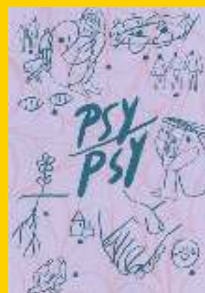
brochures publiées par les groupes, à télécharger sur le site du syndicat.